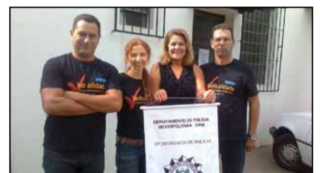
Porto Alegre - 19ª DP