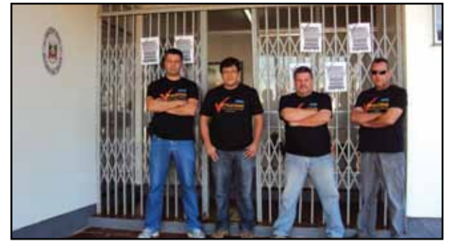
Salto do Jacuí