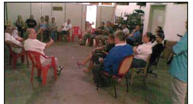
Plenária de Osório