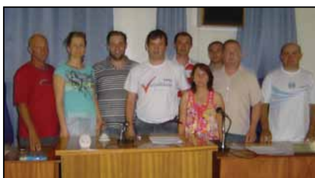
Câmara de Ametista do Sul