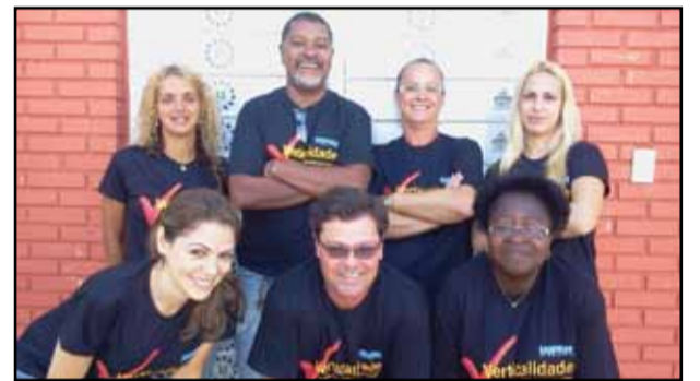
Capão da Canoa