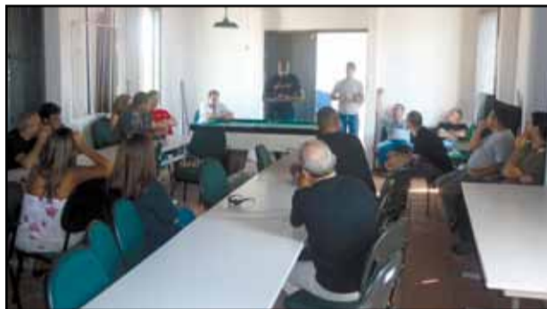
Plenária do Denarc