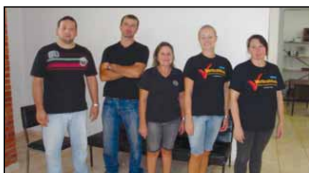
Palmeira das Missões