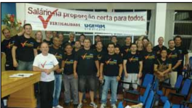
Plenária de Soledade