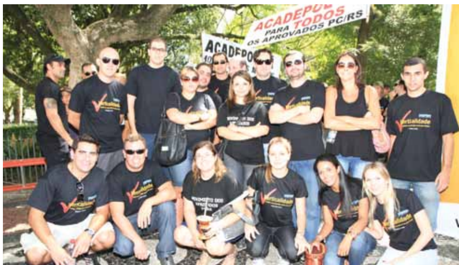
2012: Novos policiais participaram da luta da Ugeirm em ato público no Palácio Piratini