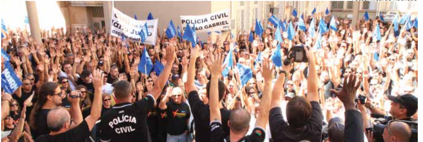
Categoria aprova dois dias de protesto e ampliação da Operação Cumpra-se a Lei.

O dia 16 de março de 2012 é uma data histórica para a Polícia Civil gaúcha e para sempre deve ser lembrado como tal. Os preparativos, os encaminhamentos e as decisões da categoria demonstraram não só grande capacidade de organização e de unidade, mas equacionaram força e responsabilidade numa estratégia de êxito.