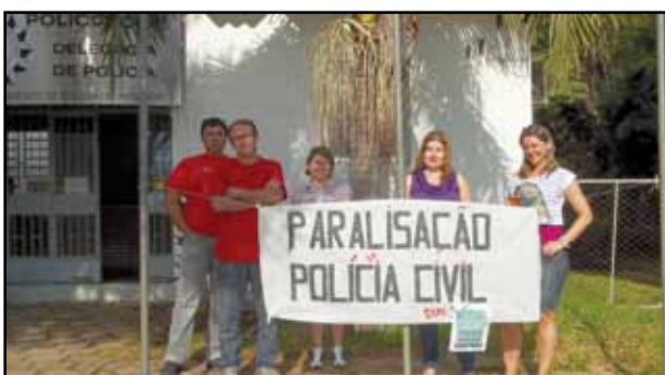
São Francisco de Assis