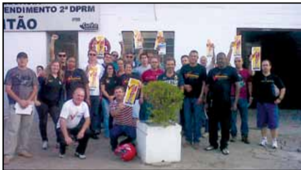
Plenária de Canoas