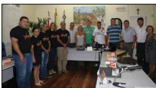
Câmara de Ivoti