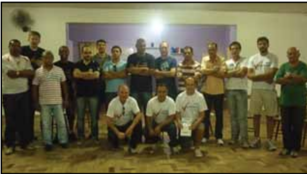
Plenária de Santa Cruz