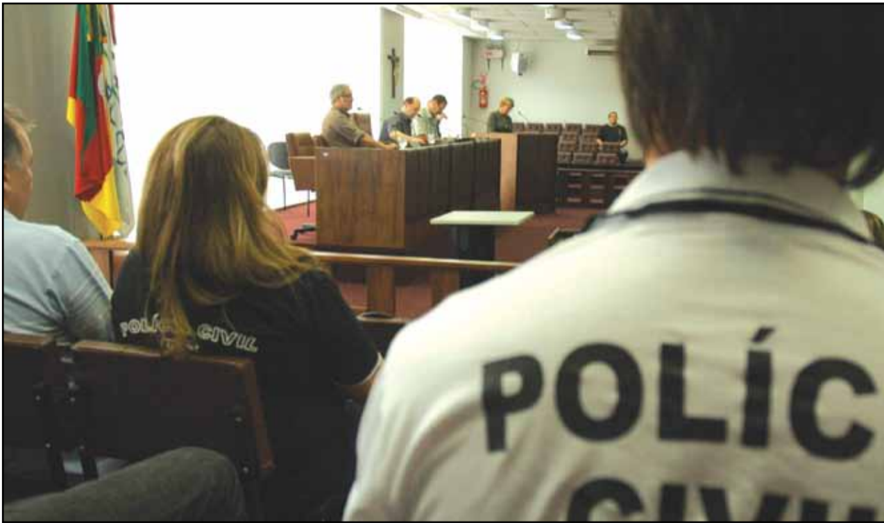
Câmara de Bento Gonçalves