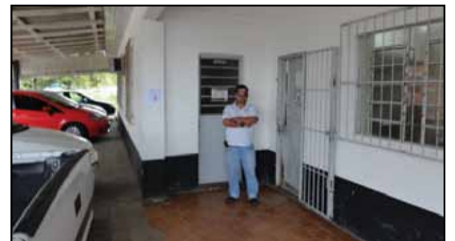
São Francisco de Paula