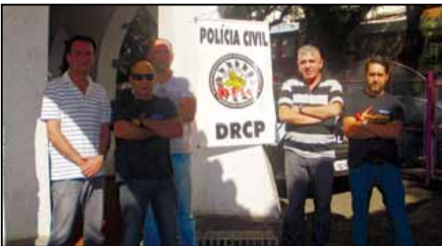
Deic - DRCP