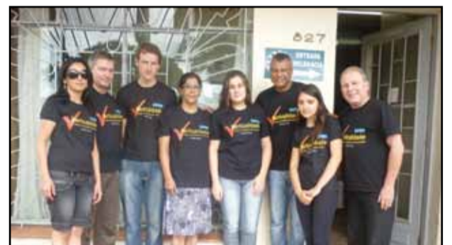
Visita a São Sebastião do Caí