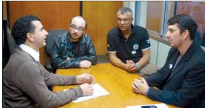
Audiência com o deputado estadual Jeferson Fernandes (PT)