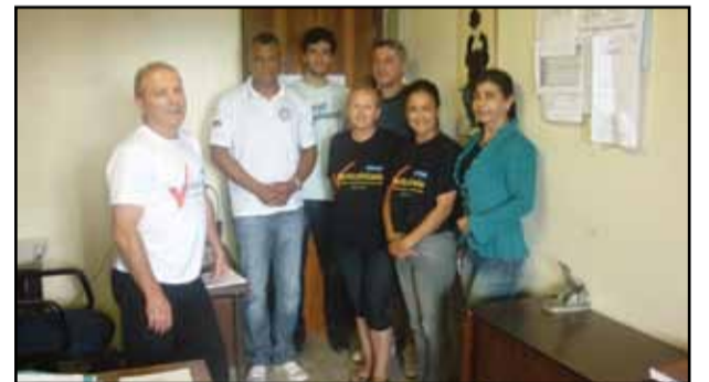
Plenária de Imbé