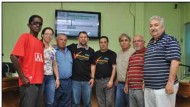
Câmara de Capão do Leão