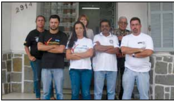
Porto Alegre - 8ª DP