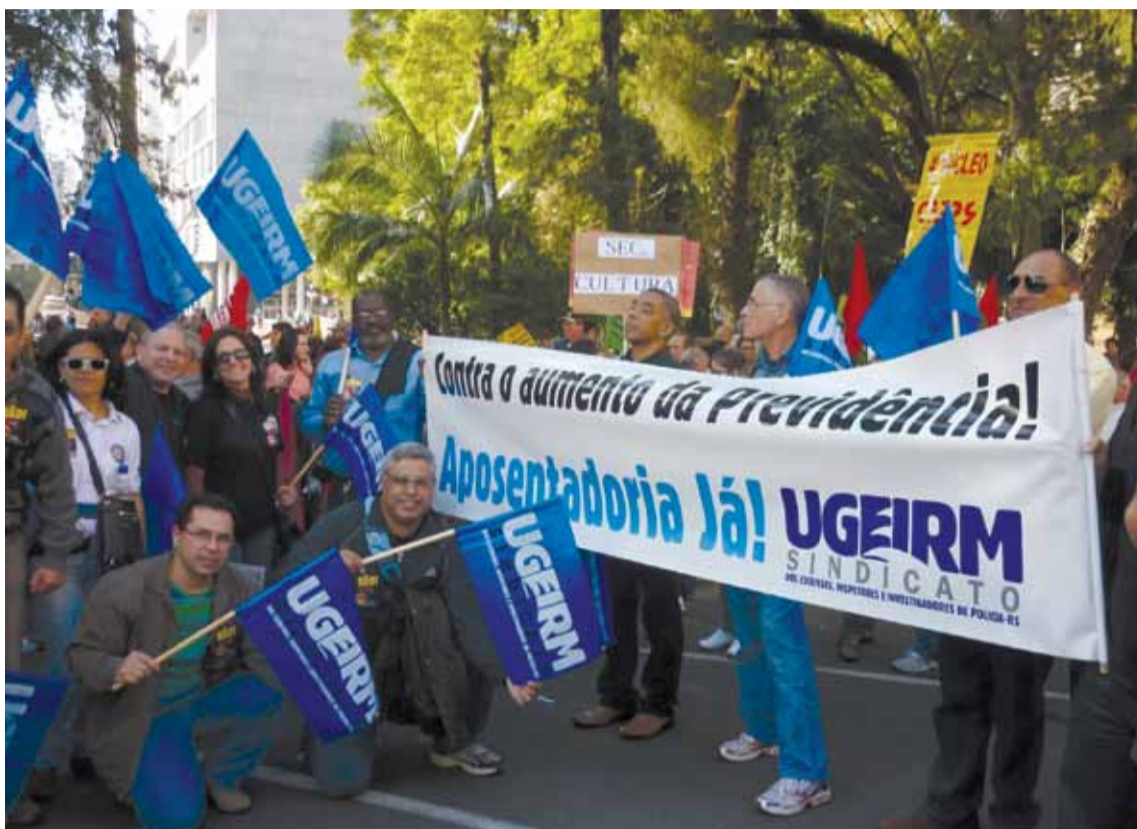
Maio de 2011: Ugeirm exige aposentadoria especial e protesta contra “Pacotarso”

Pois o “novo” entendimento da PGE foi negar direitos de integralidade e de paridade, bem como não revisar prejuízos de policiais que se aposentaram sob entendimento equivocado. Houve uma reunião tensa, onde o sindicato acusou a necessidade de corrigir rumos. Para negar direitos,