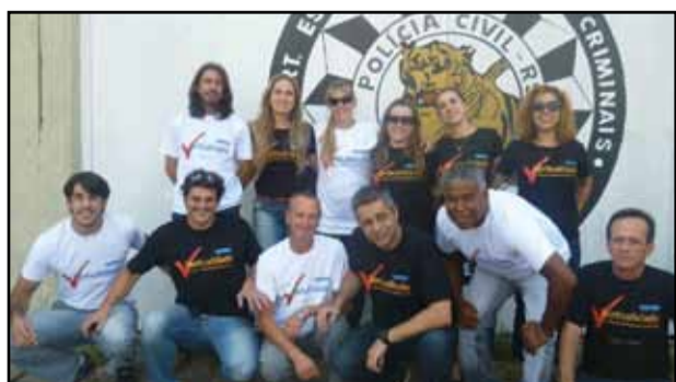
Deic - Delegacia de Roubos