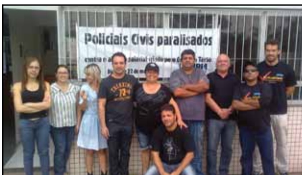
Porto Alegre - 17ª DP