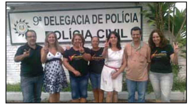
Porto Alegre - 9ª DP