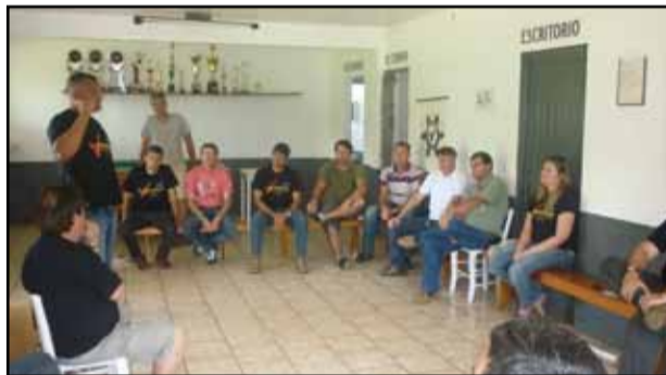
Plenária de Carazinho