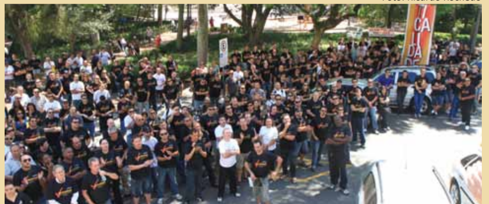
31 de janeiro: categoria recebe proposta indecorosa do governo