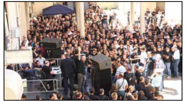
Palácio da Polícia (16 de março)