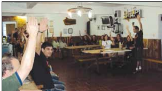
Plenária de Ijuí