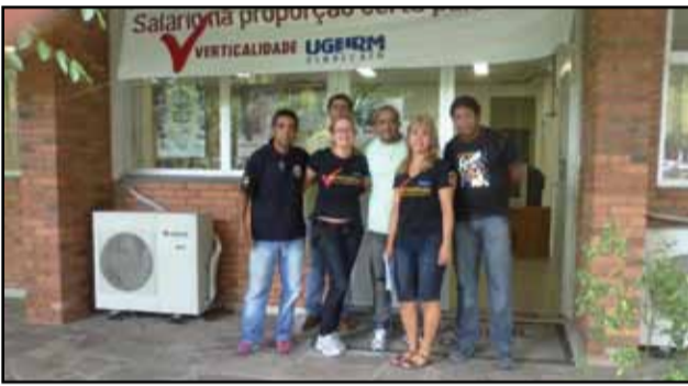
Porto Alegre - 2ª DP