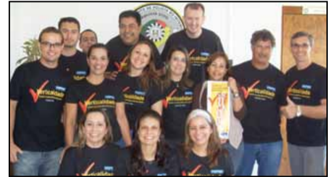
DPI - Porto Alegre