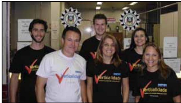
DPtran - Porto Alegre