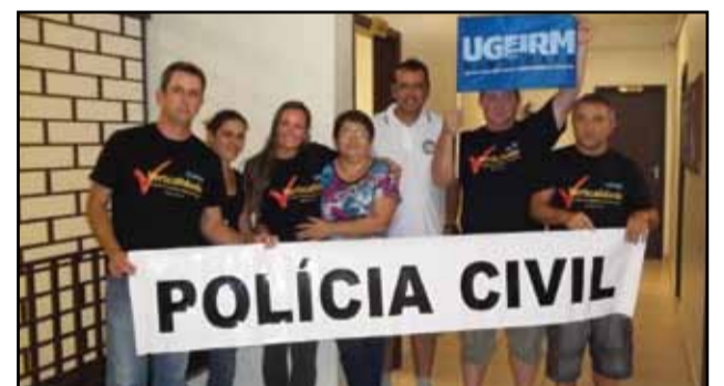
Santo Antônio da Patrulha