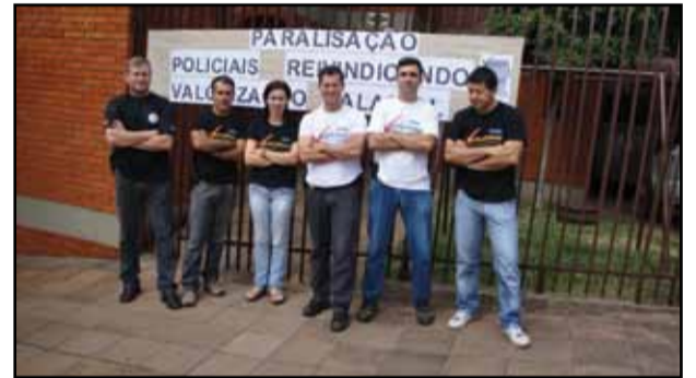
Passo Fundo - Defrec