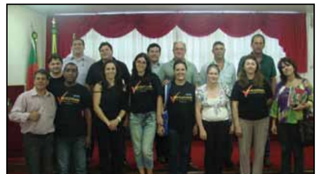
Câmara de Vacaria