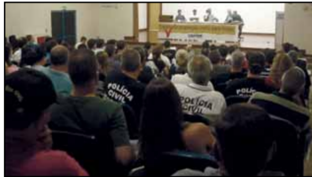
Plenária de Santa Maria