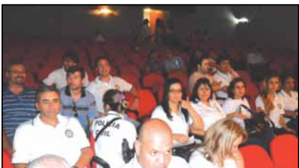
Câmara de Bagé