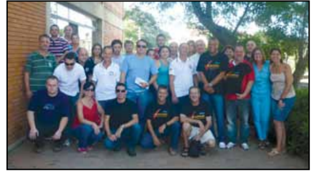
Plenária de Cachoeira do Sul