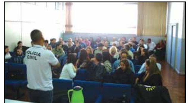
Plenária de Caxias do Sul