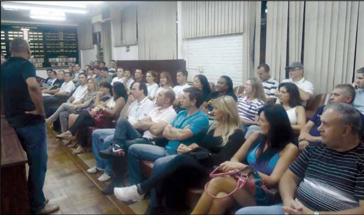
Plenária de Passo Fundo