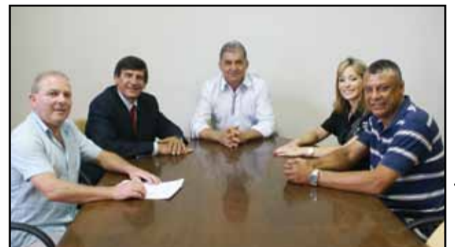
Prefeitura de Gravataí