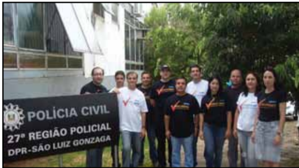
São Luiz Gonzaga