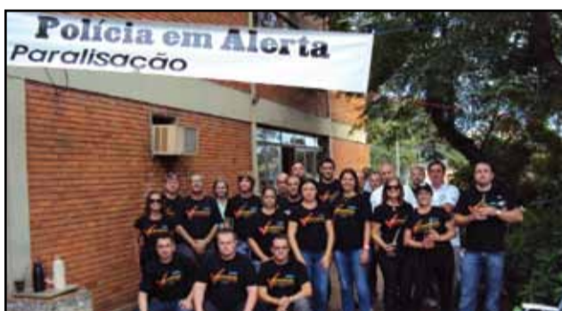
Cachoeira do Sul