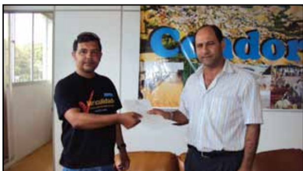
Câmara de Condor