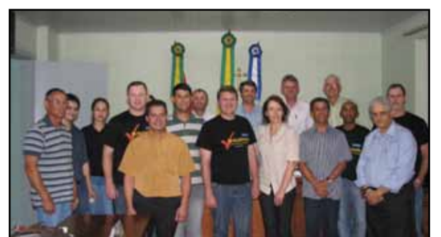
Câmara de Nova Petrópolis