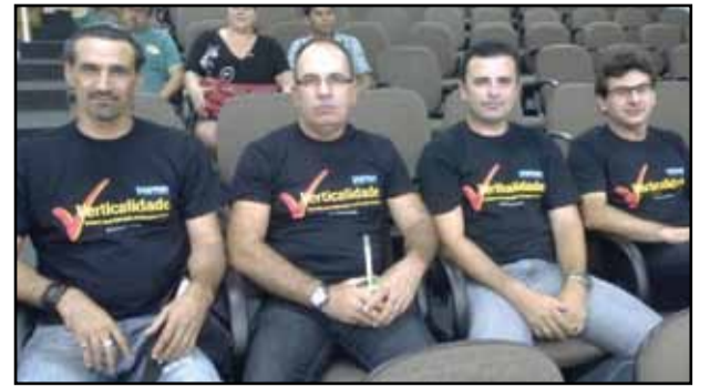
Câmara de Campo Bom