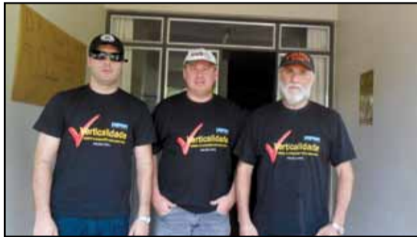
Pinhal / Rodeio Bonito