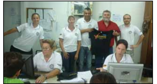
Visita a Capão da Canoa