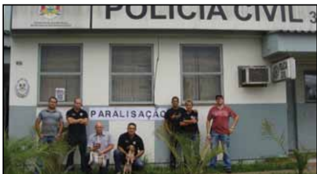
Canoas - 3ª DP