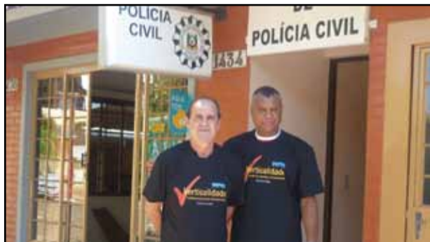
Visita a Nova Esperança do Sul