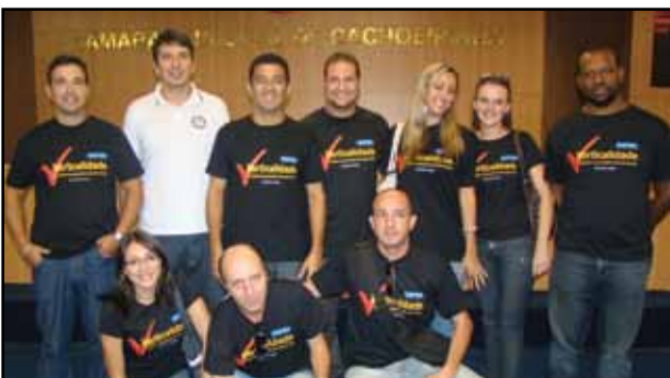
Câmara de Cachoeirinha