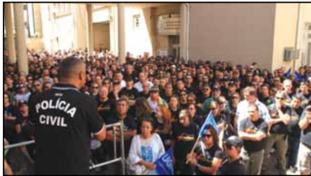
Palácio da Polícia (16 de março)