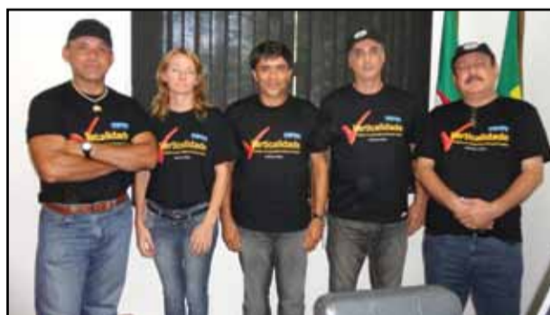
Palmares do Sul