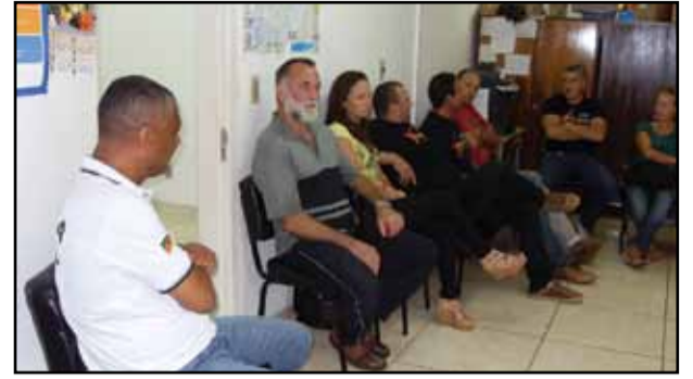
Plenária de Palmeira das Missões