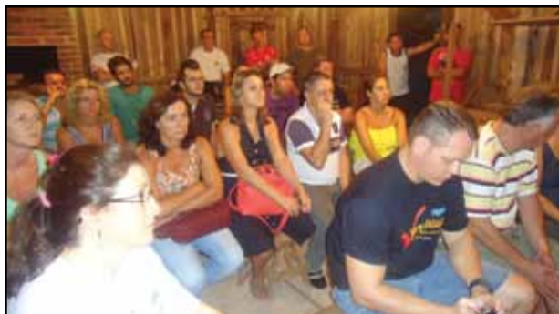
Plenária de Lajeado