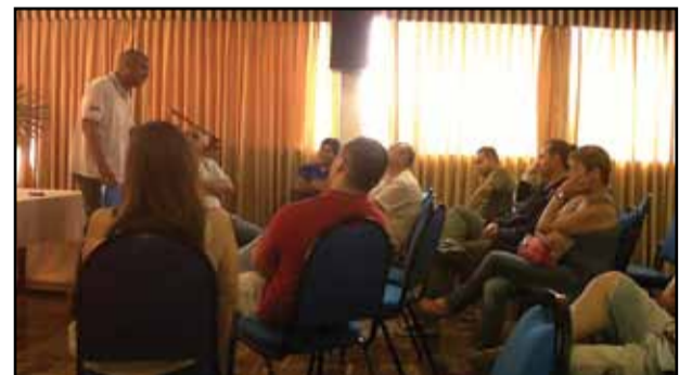
Plenária de Uruguaiana