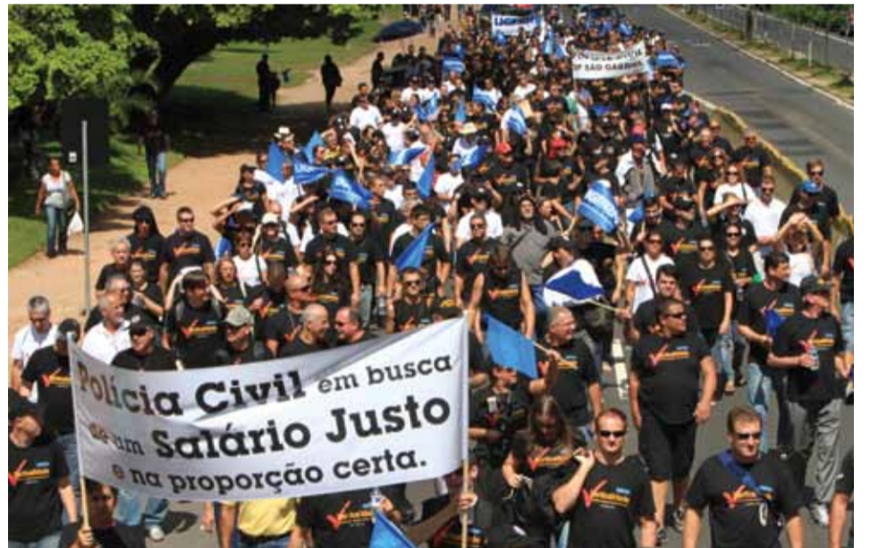
Marcha gigante passa pelo Parque da Redenção a caminho do Palácio Piratini