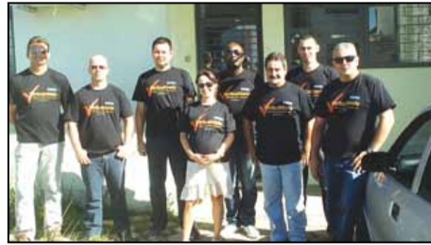
São Lourenço do Sul