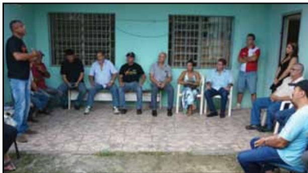
Plenária de Gravataí