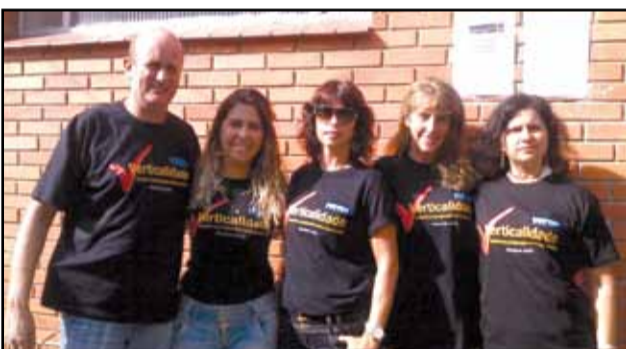
Porto Alegre - 10ª DP