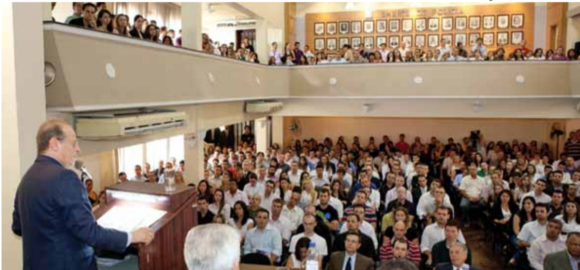
Governador confirma convocação de todos os aprovados na Aula Magna

O sindicato quer acreditar que erros do passado serão definitivamente superados. Também porque a atual turma já enfrentou meses de espera para iniciar a Acadepol – e algumas centenas de aprovados tiveram que aguardar ainda mais pela convocação para o curso de formação que conclui o processo seletivo.