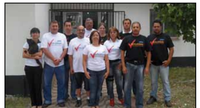
Cassino - Rio Grande