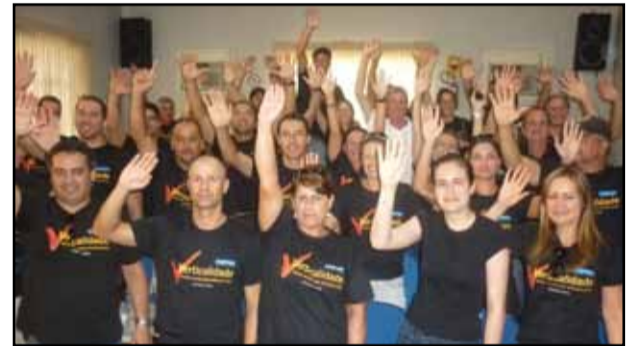
Plenária de Santiago