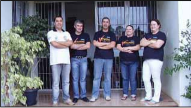
São José do Ouro