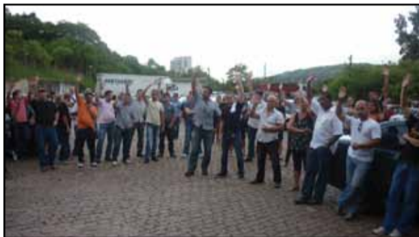
Plenária do DEIC