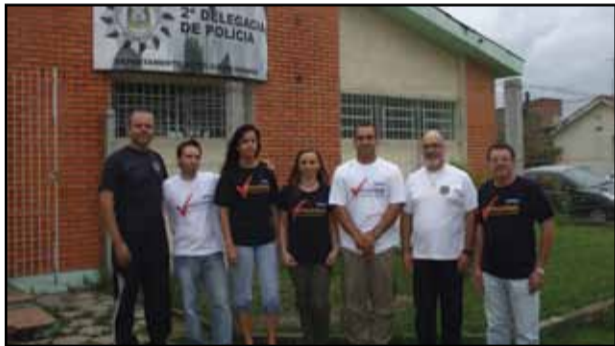
Pelotas - 2ª DP