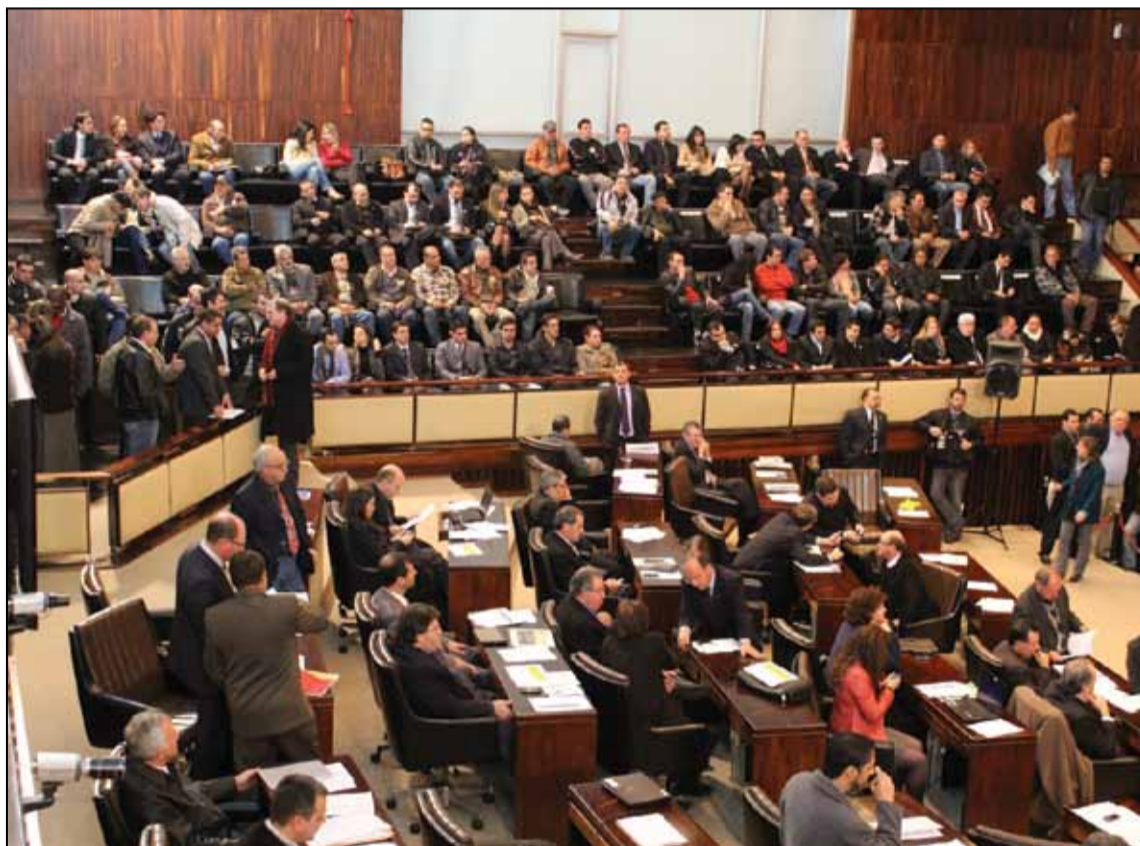
Delegados foram às centenas pressionar Assembleia Legislativa contra agentes policiais

A emenda que a Casa Civil remeteu à Assembleia Legislativa para a vinculação de oficiais e praças da BM era