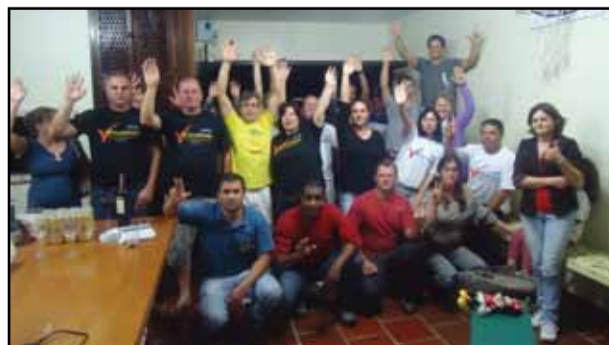
Plenária de Vacaria