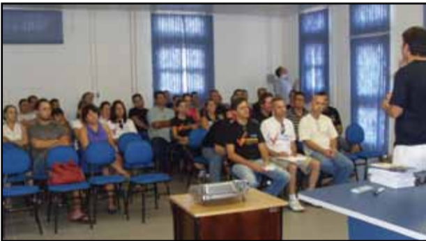
Plenária de Santo Ângelo