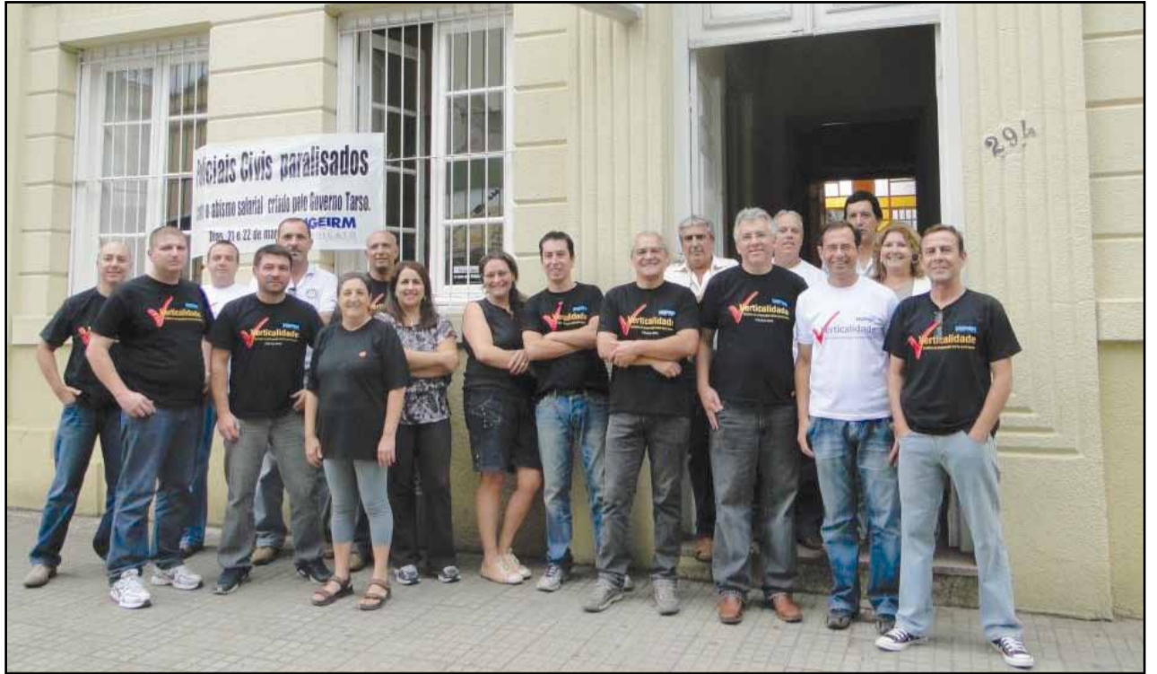
Santana do Livramento