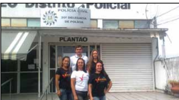
Porto Alegre - 20ª DP