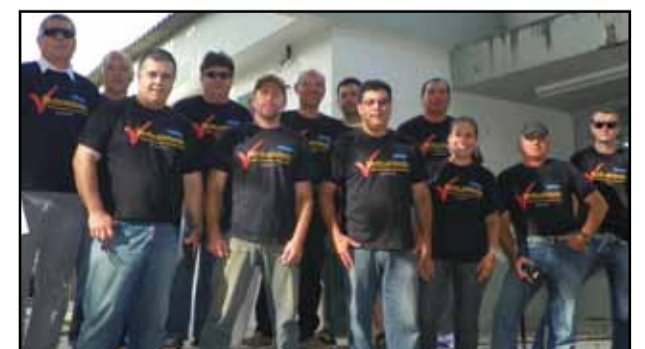
Rosário do Sul