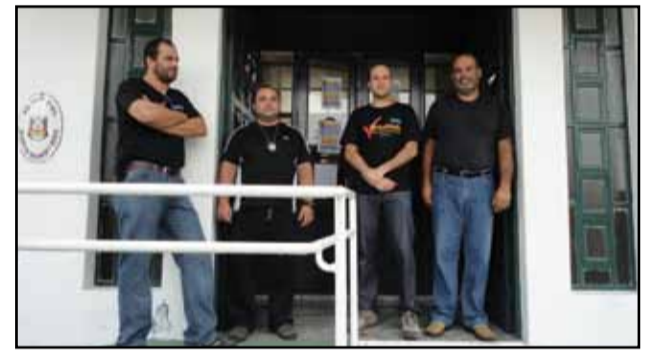
Santa Vitória do Palmar