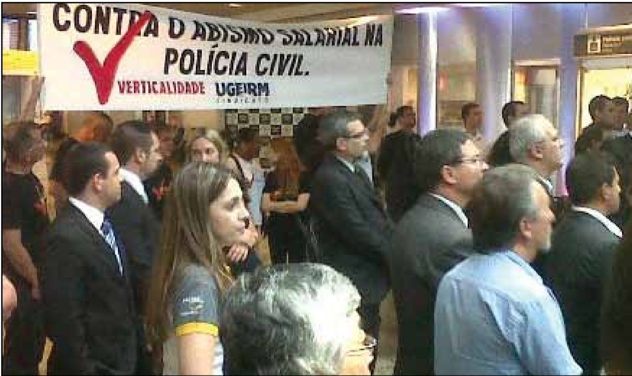
Inauguração da Delegacia do Turista - Aeroporto Salgado Filho