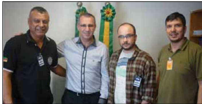
Audiência com deputado estadual Jorge Pozzobom (PSDB)