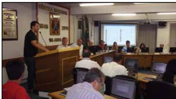
Câmara de São Leopoldo