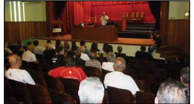
Plenária de Pelotas