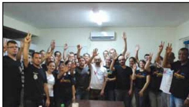
Plenária de Três Passos