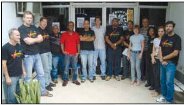
Santa Cruz do Sul