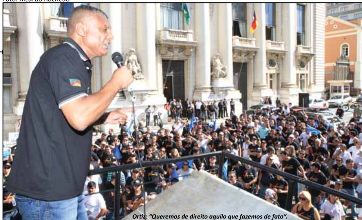
Ortiz: "Queremos de direito aquilo que fazemos de fato".