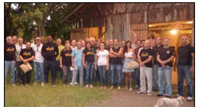
Plenária do Vale do Sinos