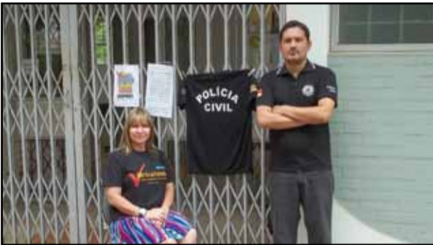
São Paulo das Missões