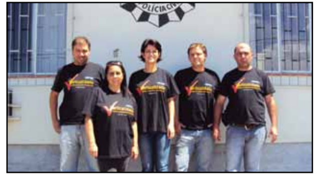
Caçapava do Sul