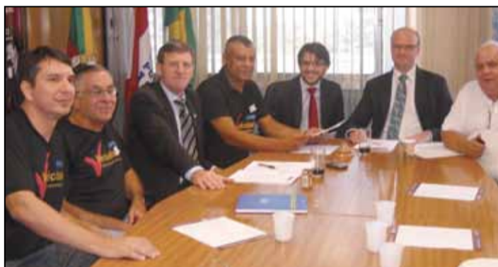
Audiência com deputados estaduais da bancada do PDT