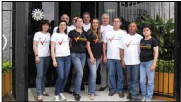
Pelotas - Regional