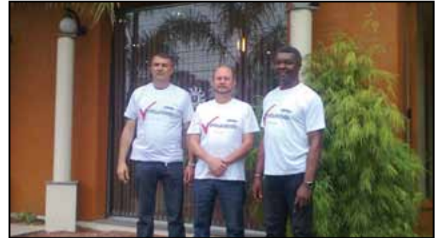
Canoas - 4ª DP