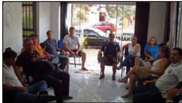
Plenária de São Luiz Gonzaga