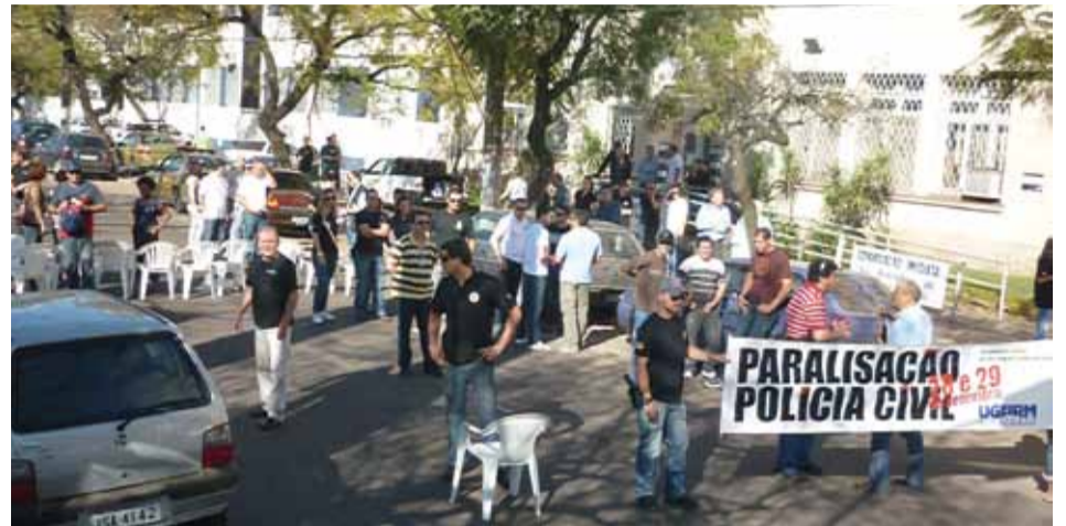
Ugeirm lidera dois dias de paralisação em setembro de 2011

“Não existe sindicato amiguinho do governo. O núcleo duro de decisão dos governos não mede só discurso, mas a real capacidade de mobilização e de