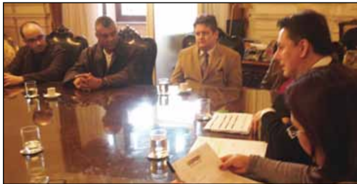
Reunião com chefe da Casa Civil, Carlos Pestana