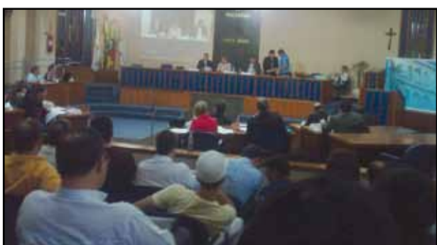
Câmara de Santa Maria