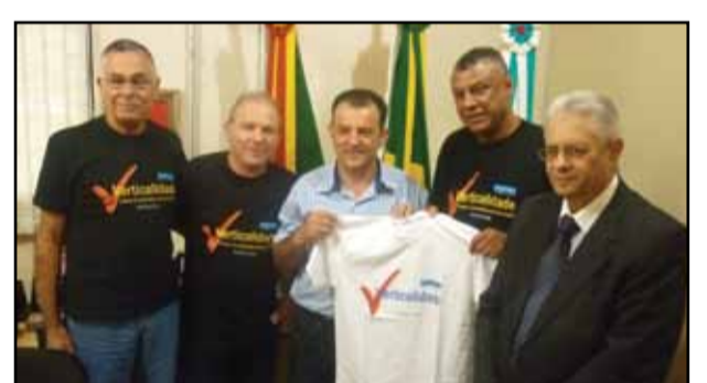
União dos Vereadores do RS (Univergs)