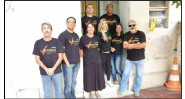
Deic - Decon