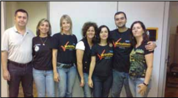
Diplanco - Porto Alegre