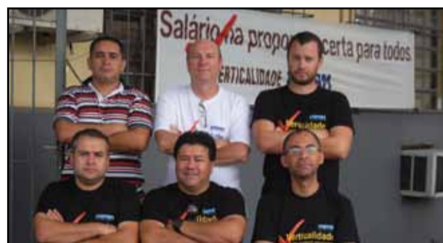
Uruguiana - Defrec