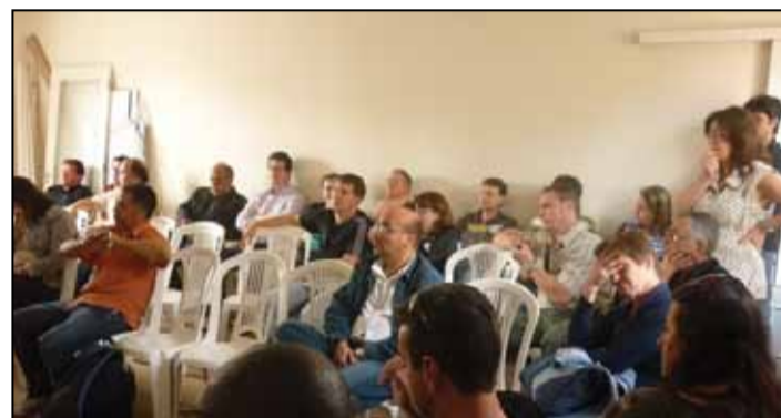
Reunião do Conselho de Representantes da Ugeirm