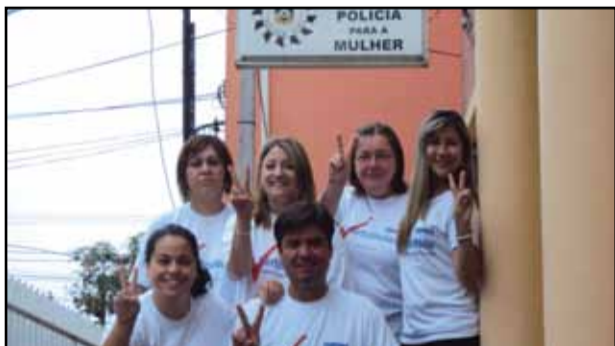
Delegacia da Mulher - Santa Maria