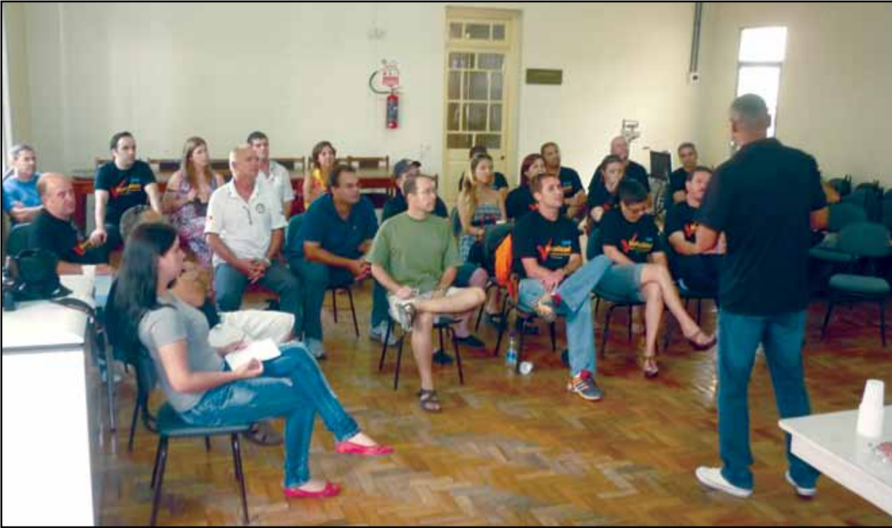
Plenária de Bagé