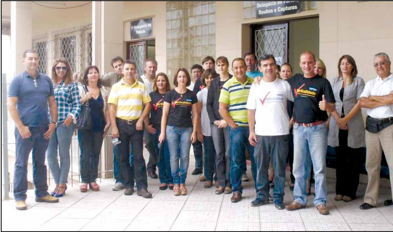
Caxias do Sul