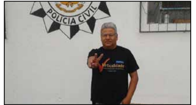
Cambará do Sul