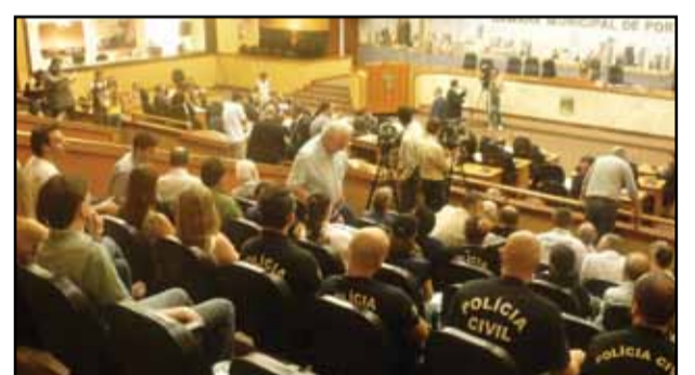
Câmara de Porto Alegre