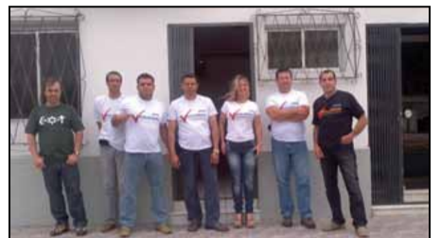
Rio Grande - 1ª DP