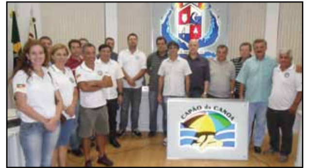
Câmara de Capão da Canoa