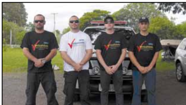
Uruguaiana - 2ª DP