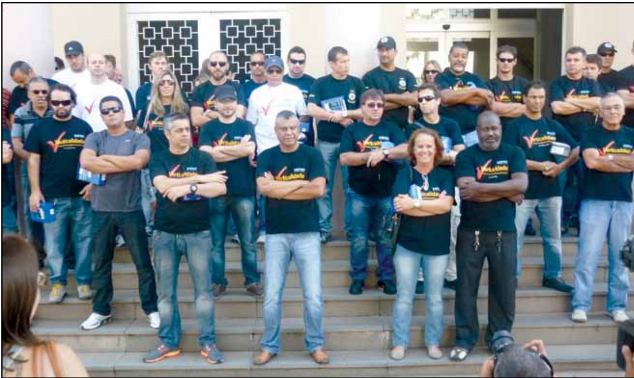
Deic - Entrega de telefones funcionais no Detel (Palácio da Polícia)