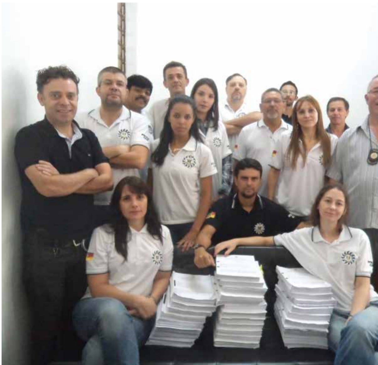
Policiais Civis demonstraram seu profissionalismo e solidariedade durante a tragédia de Santa Maria.

Foram mais de 5000 voluntários, entre agentes policiais e outros profissionais que prestaram serviços no dia. Brigada Militar, IGP, Exército, Aeronáutica, Polícia Rodoviária Federal, profissionais da área da saúde, voluntários anônimos, que se envolveram diretamente no resgate às vítimas, também merecem ser parabenizados pela doação, coragem e fraternidade num momento tão calamitoso.