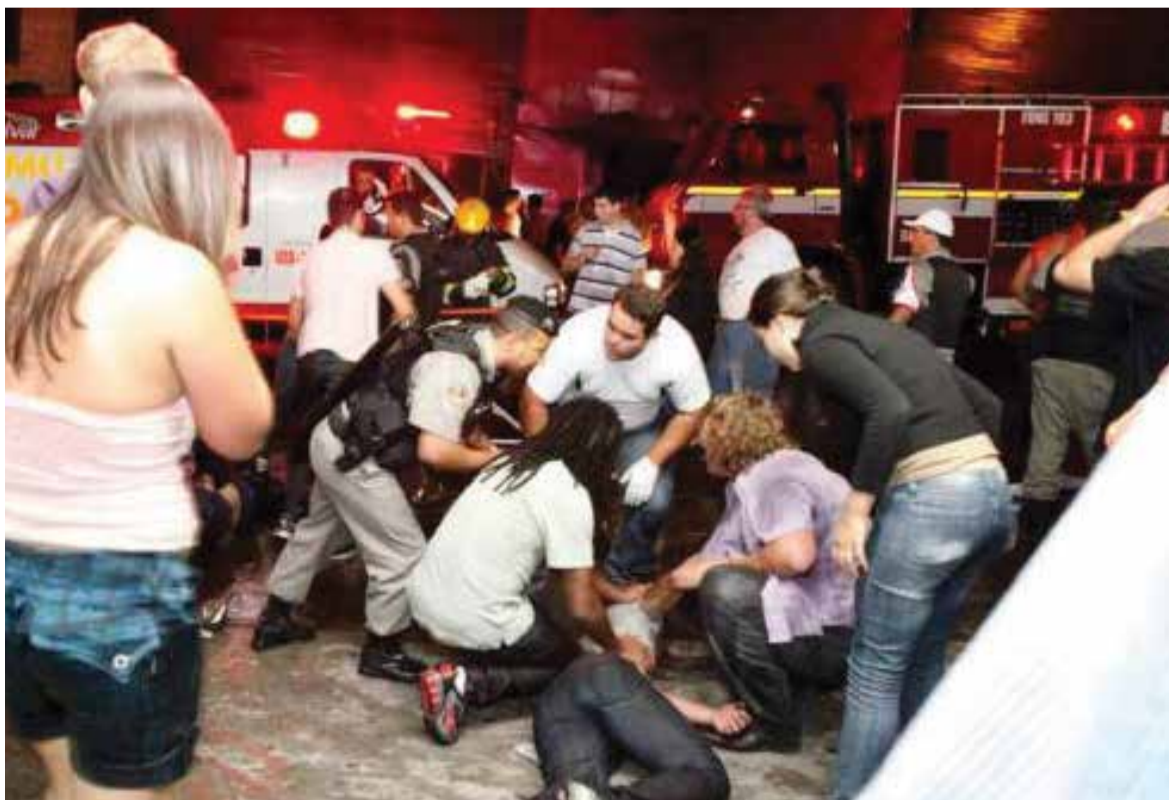
Populares se juntaram aos profissionais e voluntários no atendimento às vítimas do incêndio.